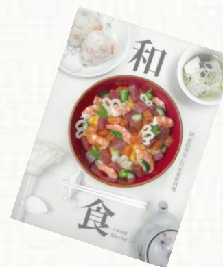
書名:和食——66道經典用心日本家常料理 索書號:427.13 2121