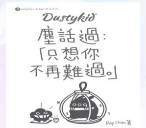
書名：只想你不再難過 索書號：948.11 2008