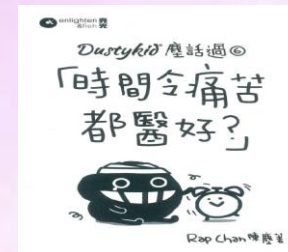
書名：「時間令痛苦都醫好」 索書號：948.11 7529