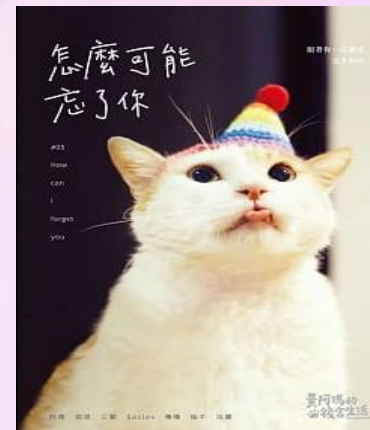
書名：黃阿瑪的後宮生活： 怎麼可能忘了你 索書號：437.6707 4480