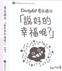
書名：說好的幸福呢？ 索書號：948.11 7529