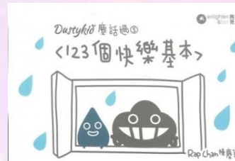
書名：123個快樂基本 索書號：948.11 2008