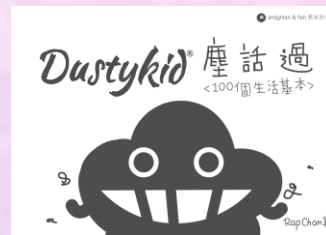
書名：100個生活基本 索書號：948.11 2008